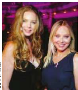
Gala für Krebshilfe mit Rebekka Bakken und Ornella Muti in Wien.

Ebreichsdorf/Wien. Im Rahmen der diesjährigen „Pink Ribbon Night“ der Österreichischen Krebshilfe waren unter anderem Nationalrats-