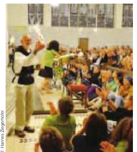
Die Ideen wurden in Vorträgen, Workshops und Projektgruppen erarbeitet.

her zu einer internationalen Plattform für all jene heran, die das Gesundheitswesen aktiv mitgestalten wollen.