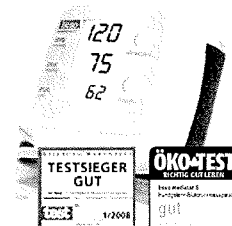
boso medistar S Handgelenkgerät

Erhältlich in Apotheke und Sanitätsfachhandel